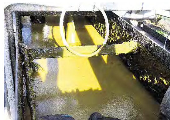
Die separierte Dünngülle (Fugat) ist ein hochwertiger Wirtschaftsdünger: weniger Ätزشäden, schnellere Infiltration, weniger Ammoniakverluste, beschleunigte Düngewirkung.

leicht erhöht, während Ammonium-N und Kalium oftmals im Fugat in höherer Konzentration zu finden