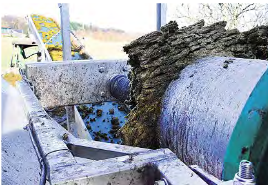
Die stapelfähigen Feststoffe wirken wie ein Schwamm. Der Lagerraumbedarf im Dünngüllebehälter sinkt um bis zu 20 %.