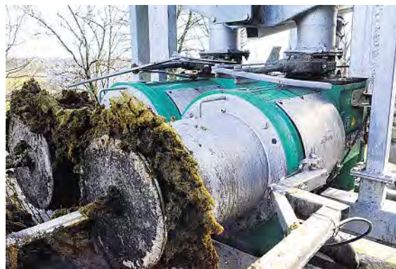
Austritt der Feststoffe an den Stirnseiten zweier Pressschnecken-Separatoren. Mit den pneumatischen Gegendruck-Stempeln kann der gewünschte Trockenmassegehalt der Feststoffe eingestellt werden.

Die Kosten für den mobilen Separator werden nach Einsatzstunden zuzüglich Anfahrt und Pauschale für Auf- und Abbau abgerechnet. Damit ist der Preis je Kubikmeter separierter Rohgülle abhängig vom Durchsatz der Maschine. Die Leistung der gängigen Pressschnecken-Separatoren hängt vorwiegend vom Trockenmassegehalt, dem Gehalt an Schleimstoffen sowie der Viskosität der Ausgangsstoffe ab. Den höchsten Durchsatz und Abscheidegrad